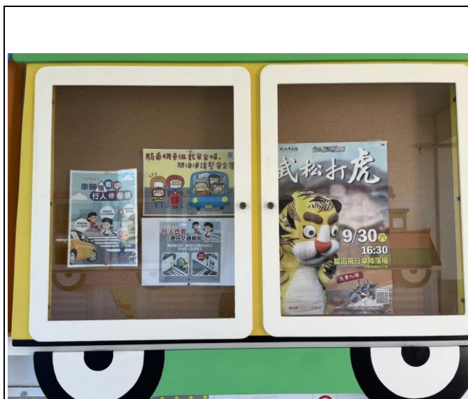
說明：於中走廊張貼交通安全文宣