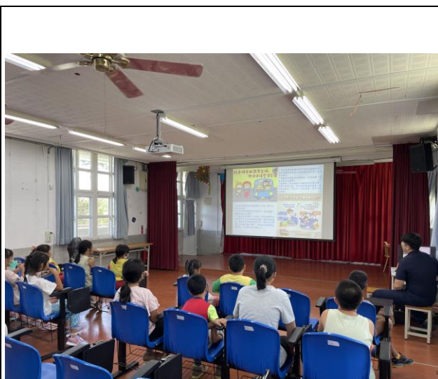
說明：關山分局進校進行交通安全宣導