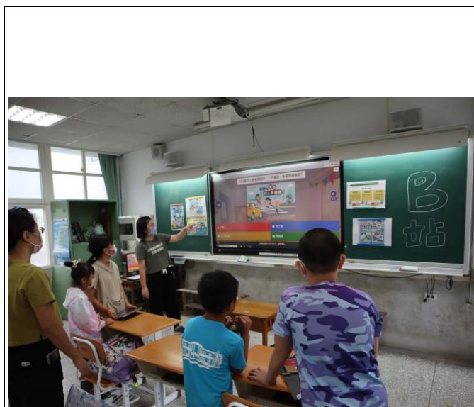
說明：於友善校園闖關時進行交通安全 kahoot 答題